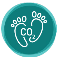
Gemeinsam CO 2 senken

Die Schweiz soll ab 2050 nicht mehr Treibhausgase ausstossen, als durch natürliche und technische Speicher aufgenommen werden können. Dieses sogenannte Netto-Null-Ziel hat der Bundesrat im Jahr 2019 verabschiedet. Die Unternehmen in der Schweiz spielen eine massgebliche Rolle bei der erfolgreichen Realisierung dieser Klimaziele. Damit diese Ziele transparent, konkret und erfolgreich umgesetzt werden, haben diverse Unternehmen in Zusammenarbeit mit dem Swiss Green Economy Symposium (SGES) gemeinsam die Plattform «Swiss Climate Action Initiative», kurz SCAI, gegründet.