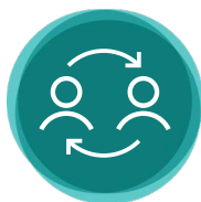
Wissenstransfer und Synergien